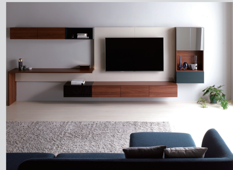
TVボード FIT MARGIN

収納コンサルティングにてご提案した家具の他にも、素敵な家具をたくさん取り揃えております。 片付けたい場所に適した収納があることで、 生活がずっと楽で快適になりますので、ぜひご検討ください。