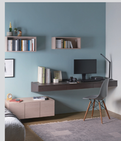
デスク収納 FIT MARGIN

サイズ：トータル W2000 D354 H250 価格：合計¥191,400 (税込み) ※TV 下部収納のみの価格となります