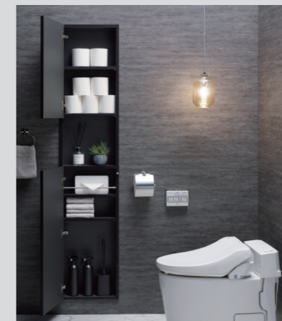
トイレ収納 FIT MARGIN

サイズ：W1801 D471 H197 価格：合計¥106,700 (税込み) ※デスクのみの価格になります