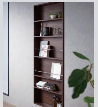
埋込収納 FIT MARGIN